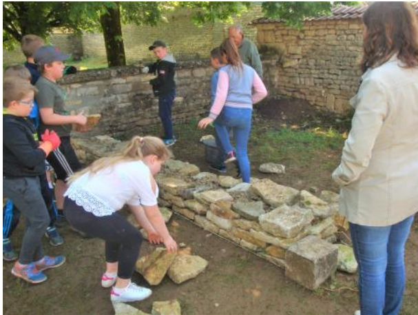
Ecole de Vilaines en Duesmois, assemblage en pierre

sommes à la recherche d'un artisan il n'est pas facile de trouver celui qui