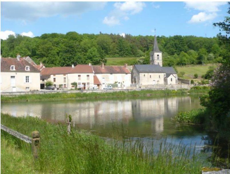
Rochefort sur Beuvron

(revendication déjà portée par l’ARPOCH et Hydrauxois)