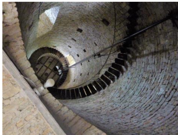
L’intérieur de la tour